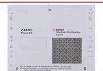
Enveloppe universelle de mot de passe